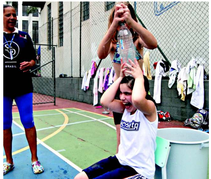
Brincadeiras com água foram utilizadas no evento como forma de refrescar as crianças