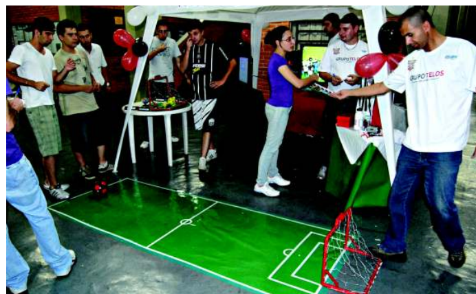
O minigol chamou bastante a atenção das pessoas que passaram pelo local