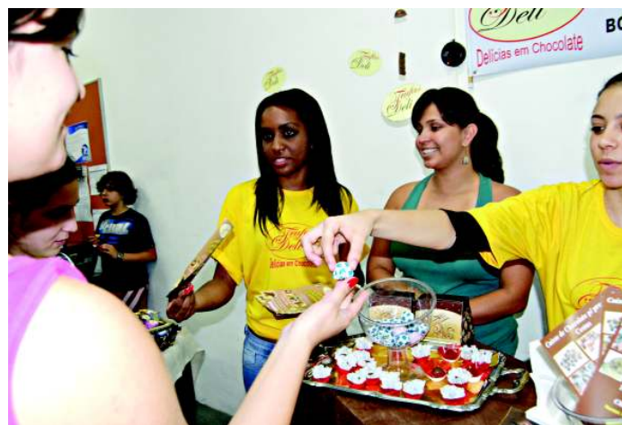
O visitante que compareceu ao evento pode degustar diversos chocolates