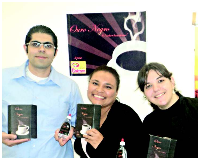
Evento contou com a participação de alunos do curso de Administração