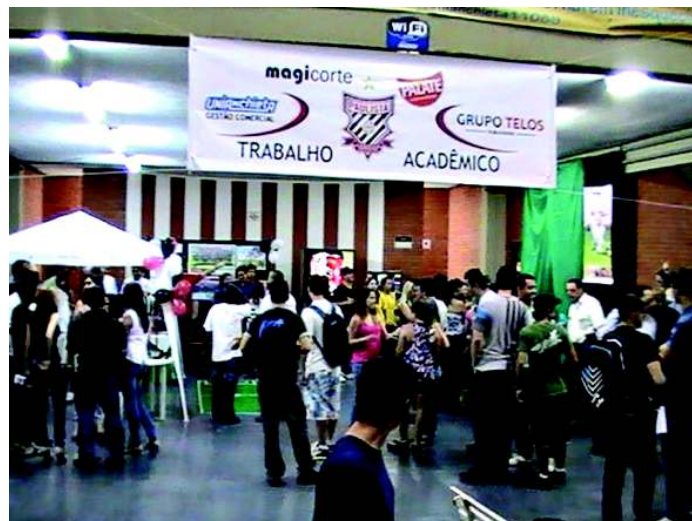
Os trabalhos chamaram a atenção do público que passou pelo prédio