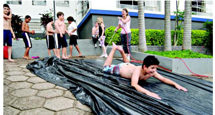
O toboágua fez muito sucesso entre os alunos

Nos dias 9 e 10 de dezembro, as Escolas Padre Anchieta realizam o projeto de encerramento “Fazer o bem faz bem no Natal também”. Na oportunidade serão apresentados números musicais e coreografias.