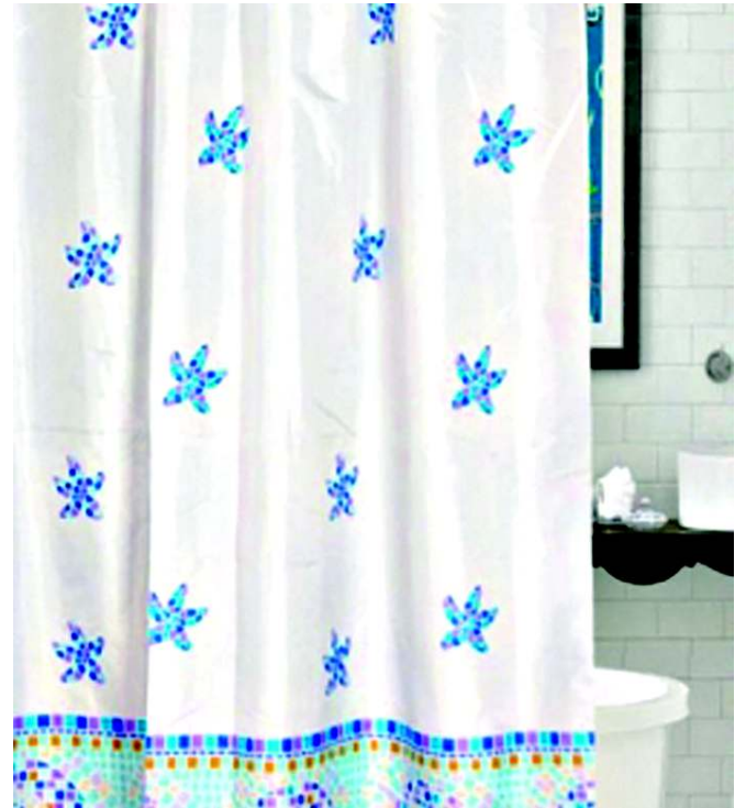
A banheira de um hotel em Paris deixou Romilda em situação complicada

Quando viajamos, temos de prestar atenção às pequenas diferenças culturais