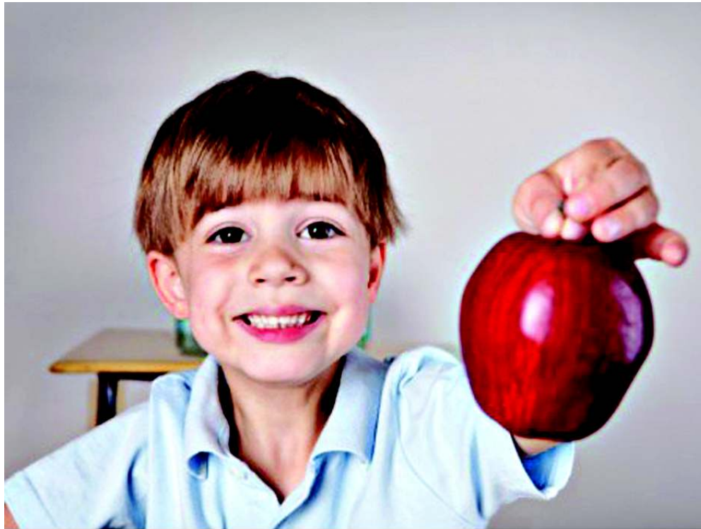
A ingestão de frutas como a maçã auxilia na boa alimentação das crianças

Esta refeição nunca é prazerosa, sempre uma tortura em função da perda de tempo. Da mesma forma o almoço”. A organização é um item que deve ser levado em consideração durante a conversa de pais e filhos. “O principal é dialogar com a criança mostrando o quanto é necessário se organizar. Fazer as coisas com mais tempo para poder fazer direito. Acordar um pouco mais cedo, assim como reservar o tempo certo para almoçar antes da escola, pode ser compensador por não ter que realizar tudo correndo!”.