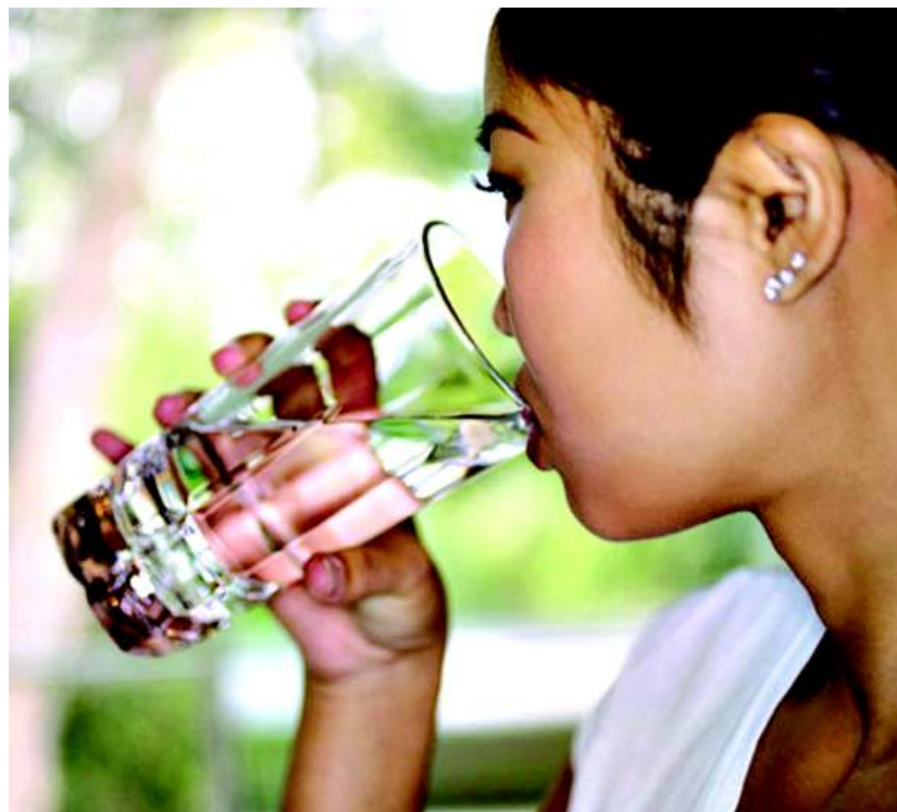
Uma boa hidratação ajuda a manter a pressão equilibrada

Muitas pessoas não conseguem se alimentar corretamente com as altas temperaturas. Uma sugestão dada pelo médico é ingerir frutas, verduras e legumes, que colaboram com a manutenção da boa saúde. "A pessoa deve procurar se adaptar a essa estação e não cometer excesso, principalmente em relação as bebidas alcoólicas". Uma outra dica dada pelo especialista é com relação as atividades físicas durante o verão. "O cidadão deve evitar praticar esportes em horários em que o calor esteja elevado. O ideal é fazer os exercícios no início da manhã ou no final da tarde".