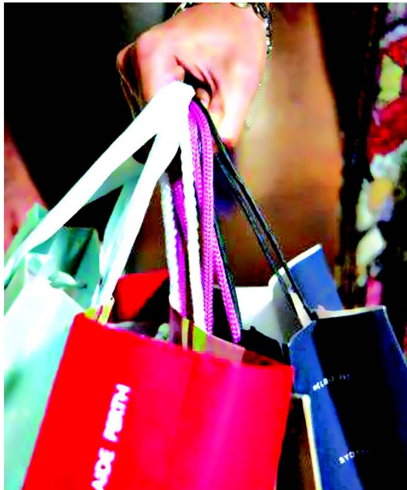
Apesar do avanço obtido com a implantação do Código de Defesa do Consumidor, muitos profissionais ainda se confundem em relação ao assunto.