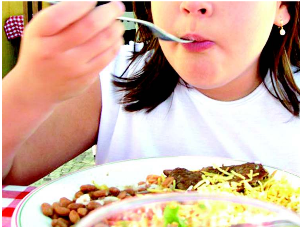
A alimentação inadequada pode prejudicar o desenvolvimento da criança

A grande maioria dos brasileiros não se alimenta corretamente. A constatação foi revelada recentemente por meio do estudo “Análise de Consumo Alimentar Pessoal no Brasil” da Pesquisa de Orçamentos Familiares realizada pelo IBGE (Instituto Brasileiro de Geografia e Estatística). O prato principal de homens e mulheres é o arroz e feijão associado a alimentos calóricos e de baixo teor nutritivo. Com isso a dieta de 90% dos brasileiros encontra-se fora do padrão recomendado pela Organização Mundial de Saúde no que se refere ao consumo de frutas, verduras e legumes. O ideal é o consumo de pelo menos 400 gramas diárias, porém nem 10% da população ingere o indicado. Para a nutricionista Ellen Rampini, o principal “culpado” desse quadro é a falta de tempo. “As pessoas até se preocupam com esse aspecto, porém com a correria do dia a dia procuram optar pelo lado prático e comem produtos de fácil preparo como feijão com arroz e uma carne”. Segundo ela, o baixo consumo de frutas, verduras e legumes acarreta diversos prejuízos ao orga-