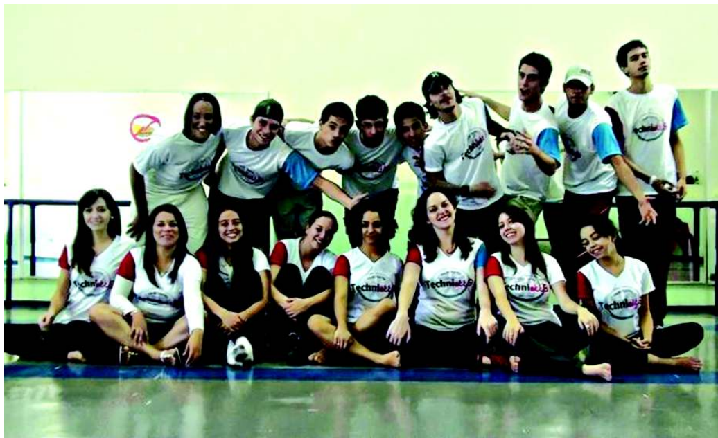
Cerca de 50 atores - boa parte deles alunos do Anchieta, formam a Companhia de Teatro TechniAtto