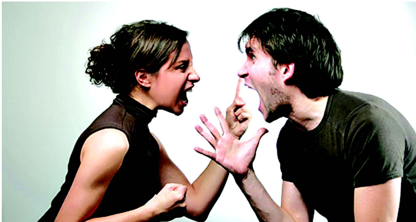
O estudo procurou demonstrar em qual momento uma relação saudável se torna doentia