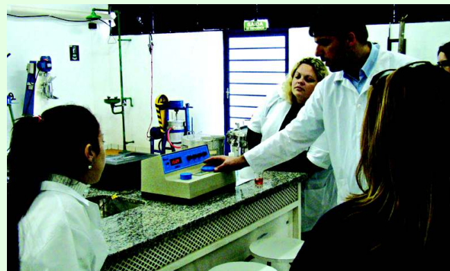
Em laboratório, alunos vivenciam conceitos de análise química ambiental

Com o objetivo de formar profissionais capacitados, responsáveis e críticos no que se refere à atuação no campo da gestão e análise de projetos ambientais, o curso de pós-graduação em Engenharia Ambiental une teoria e prática em aulas com professores experientes e atuantes na área de conhecimento, facilitando o aprendizado do estudante. Com visitas técnicas e atividades práticas em laboratório, o aluno vivencia situações cotidianas do campo de atuação da engenharia ambiental. Na primeira fase do curso o aluno estuda conteúdos básicos da área ambiental, que incluem fundamentos de ecologia, poluição, legislação, geoprocessamento, aspectos econômicos do meio ambiente e planejamento ambiental. Já na segunda fase, o estudo passa a focar em conteúdos de atuação direta do profissional em processos e projetos ambientais, que incluem gestão ambiental, ciclo de vida de produtos, tecnologia limpa, licenciamento ambiental e gestão de projetos. Para matricular-se ou ter mais informações sobre o curso basta acessar a página do UniAnchieta na internet, http://www.anchieta.br/Inscricao_Pos_2011/default.asp