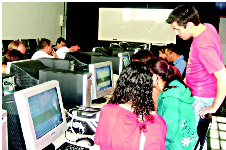
Para este ano o projeto deverá beneficiar aproximadamente 400 contribuintes