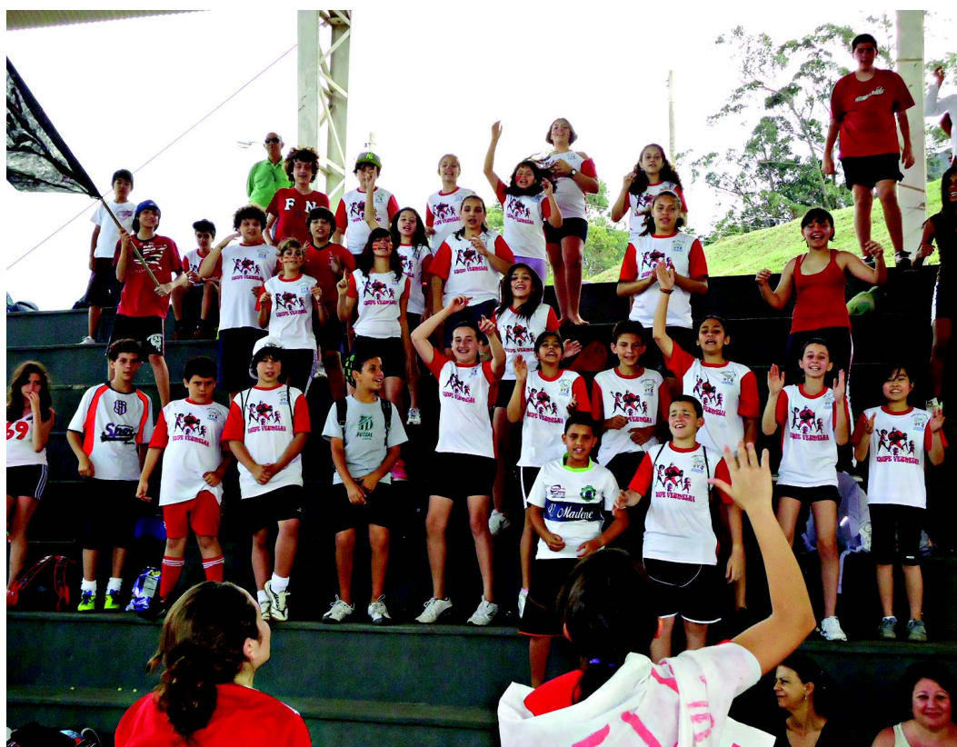
A gincana foi marcada por muita animação e gritos de guerra

Show de talentos (com apresentações de dança e música), atividades culturais (com