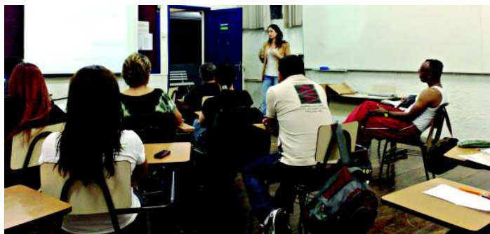
O evento foi direcionado para alunos do Curso Superior em Gestão Ambiental