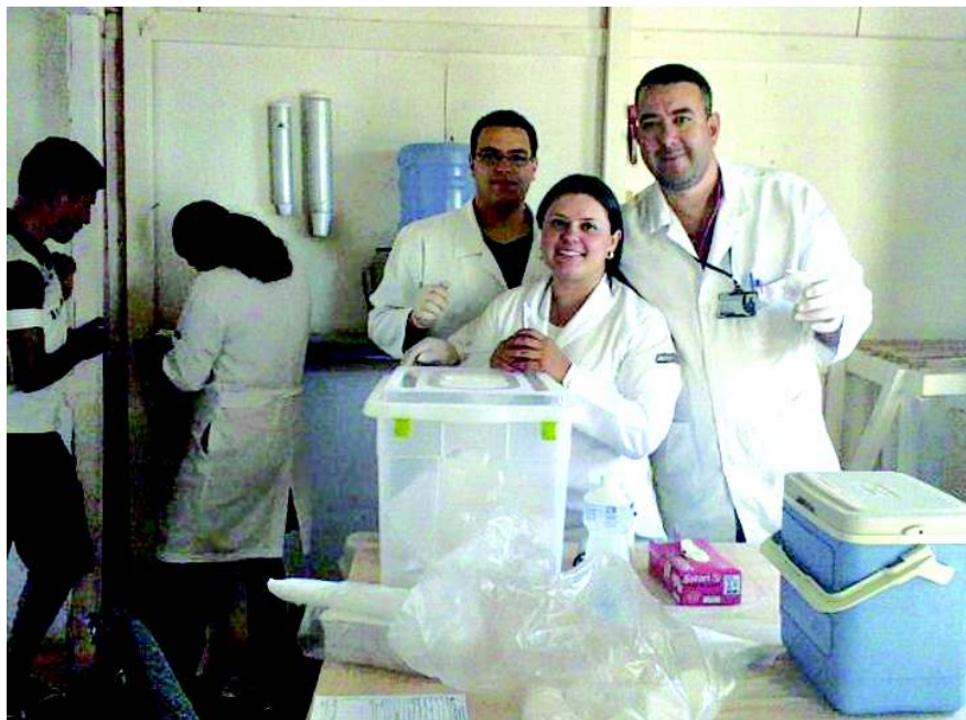
A iniciativa aproxima os alunos da prática diária da profissão