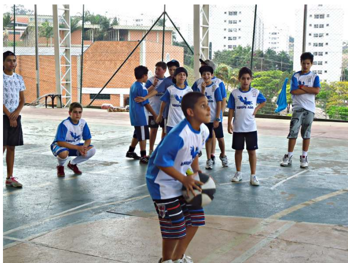
O basquete foi um dos jogos praticados pela criançada