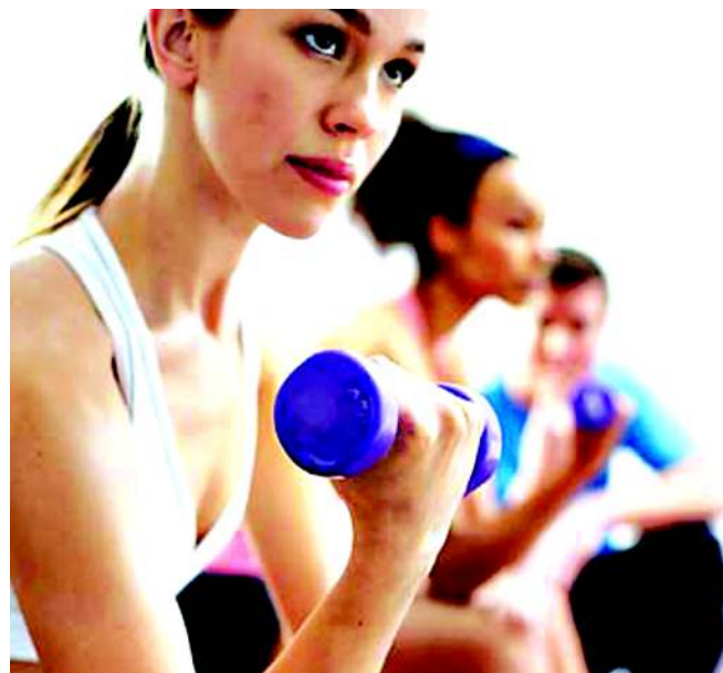
Profissional encontra-se presente em vários segmentos da sociedade

Para o coordenador do curso de Educação Física, por meio da nova proposta será possível