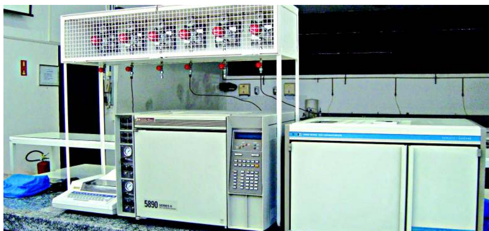
Por meio do novo aparelho os estudantes poderão, por exemplo, verificar se o combustível encontra-se adulterado