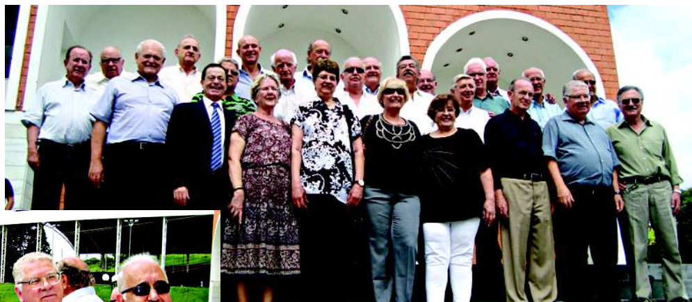
A união foi a marca principal da turma. A maior prova disso é que os ex-alunos estiveram reunidos mais de 40 anos depois.