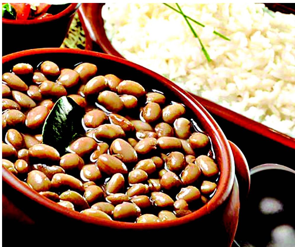
A substituição desses alimentos por produtos industrializados pode acarretar sérios transtornos a saúde

O estudo revelou ainda que a quantidade de arroz polido consumida registrou baixa de 24,5 kg per capita para 14,6 kg, ou seja, uma diminuição de 40,5%. Para o feijão, a redução foi de 26,4%: de 12,4 kg por pessoa para 9,1 kg. Já os refrigerantes do tipo cola tiveram aumento no período de 39,3%, saindo de 9,1 kg em 2002/03 para 12,7 quilos. Mesmo fenômeno foi detectado para a cerveja, de 4,6 kg para 5,6 kg, um acréscimo de 23,2%. Com a divulgação de que os brasileiros estão consumindo mais os produtos industrializados, a nutricionista chama a atenção para o risco que a ingestão desses alimentos traz para o organismo. “Pela praticidade dos alimentos industrializados, esses estão cada vez mais presentes na alimentação do brasileiro. Mas devemos ficar alertas a esses produtos, pois eles possuem grande quantidade de gorduras, sal (sódio), conservantes, corantes, álcool, que são prejudiciais à saúde. Sendo consumidos exageradamente ou frequentemente podem causar inúmeros danos à saúde como doenças cardiovasculares, câncer, alergias, entre