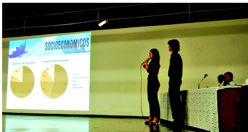
Pesquisa foi desenvolvida por alunos em quatro módulos diferentes: preços, comércio exterior, finanças públicas e produção, renda e emprego