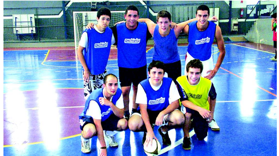
Equipe do Tititica estreou com vitória na competição