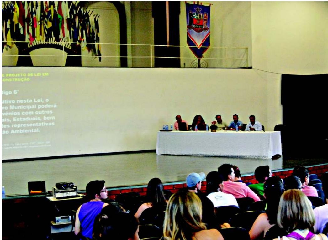
Alunos ficaram satisfeitos com as palestras e tiveram a oportunidade de conhecer a Associação que defende o setor