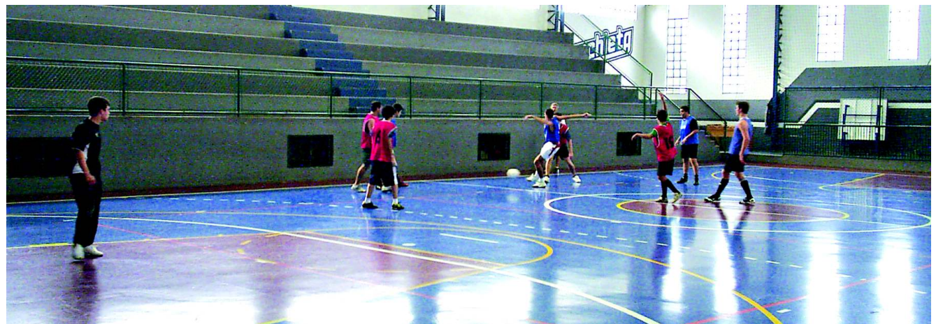
Jogadores procuraram mostrar muita raça e determinação durante a partida