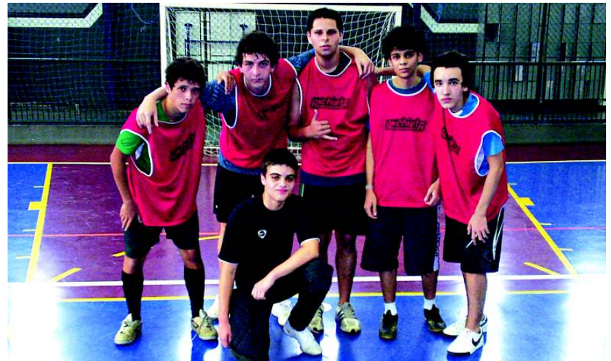
Apesar da derrota, time do Atécubanos apresentou um bom futebol