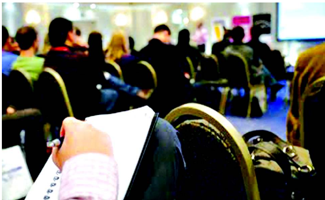
Curso foi criado para suprir a falta de mão-de-obra especializada