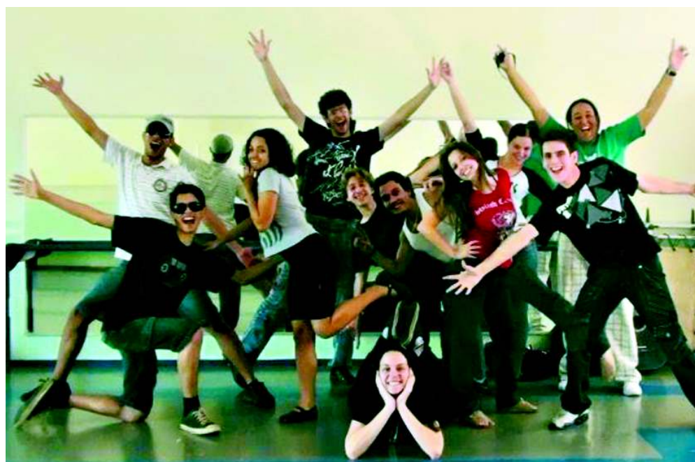
Maioria dos atores que compõem a companhia estuda no UniAnchieta

As apresentações serão realizadas às 20 horas nos dois dias e os ingressos já podem ser adquiridos. "Os ingressos já estão sendo vendidos para as duas datas de apresentação: R$ 2 antecipado ou R$ 4 no dia e ambos mais um quilo de alimento não perecível que deverá ser entregue no dia do espetáculo. Os ingressos estão a venda na Can-