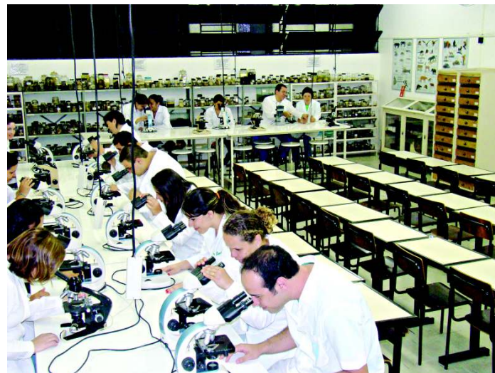
Estudantes durante aula prática no laboratório de zoologia

Os professores do curso de Biologia do UniAnchieta são