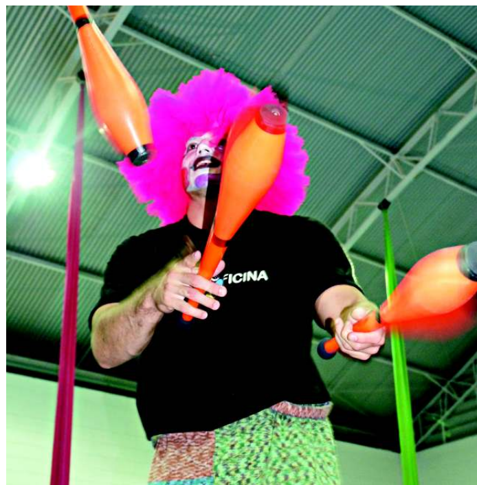
A criatividade é um dos aspectos lúdicos trabalhados no curso