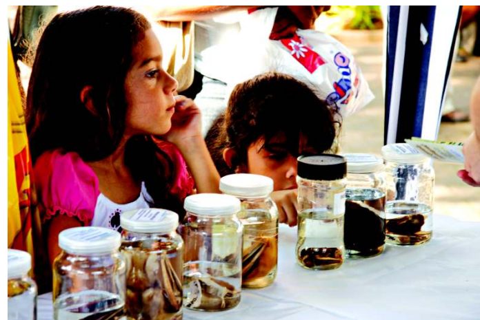
Público visitando exposição do Projeto Ciência na Praça

comprometidos com a formação dos alunos e altamente qualificados, tanto pela titulação (a grande maioria é de doutores ou mestres), quanto pela grande experiência didática no ensino superior.