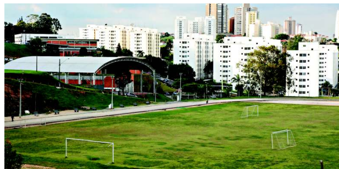
O curso conta com infraestrutura própria como campo de futebol, pista de atletismo, quadras poliesportivas, entre outros espaços

O convívio universitário é outro diferencial do curso que se relaciona diariamente e por meio de atividades e projetos com cursos do campo da saúde (fisioterapia, nutrição, enfermagem, farmácia, terapia ocupacional), com outras licenciaturas, com psicologia e demais áreas afins.