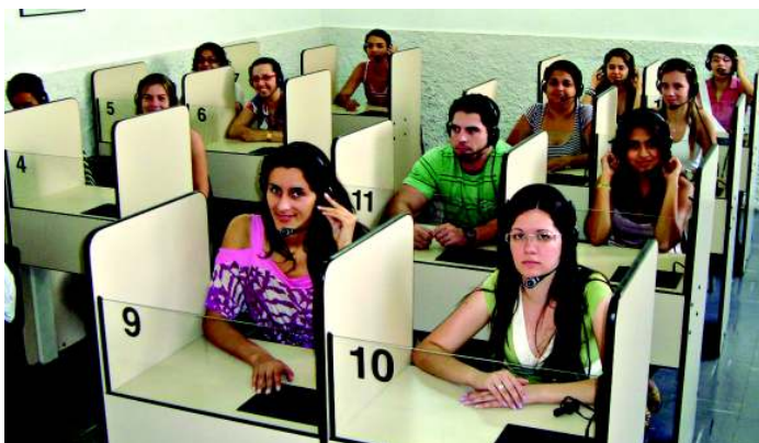
O laboratório é um dos recursos utilizados pelos alunos para aprofundar o conhecimento obtido durante o curso

Do primeiro ao último semestre do curso, o aluno tem ainda a oportunidade de conhecer o estudo nada convencional proposto pela Linguística, um campo que investiga os dialetos e variantes da língua, os sons que compõem e explicam a formação das palavras, além das inúmeras possibilidades de se pensar a estrutura de uma frase, de um pensamento, de um texto e de uma fala. No último semestre o aluno é desafiado a percorrer os caminhos do pensamento norte-americano, russo, francês, anglo-saxão, africano, grego, espanhol, alemão ou até latino pela leitura de textos que trabalham alguns Tópicos dessa Literatura chamada Estrangeira.