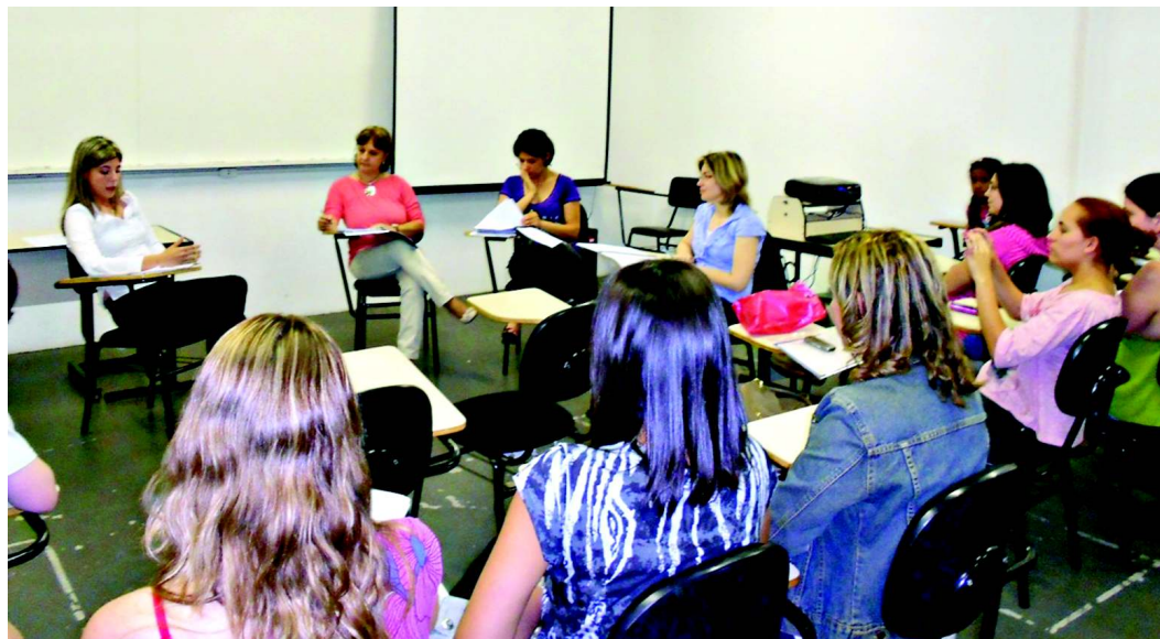
Várias atividades - como a discussão de textos de importantes autores, são realizadas ao longo dos oito semestres

Desenvolvido em oito semestres o curso conta com excelentes instalações físicas e laboratórios específicos como Brinquedoteca e Oficina Pedagógica. Tem carga horária acima da exigida por lei, incluindo 300 horas de estágio supervisionado, sendo 200 horas em docência e 100 horas em gestão, além das 100 ho-