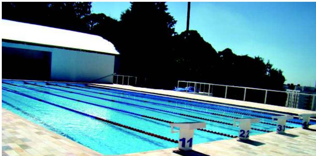
O complexo aquático compõe a infraestrutura de qualidade oferecida pelo UniAnchieta

As novas tecnologias e as mudanças na economia e no mercado ameaçam uma série de profissões que se tornam obsoletas, desnecessárias e muitas vezes desaparecem. Enquanto isso, outras se tornam cada vez mais necessárias e fundamentais para o bom andamento da vida cotidiana. Esse é o caso da Educação Física que cresce, ganhando importância e ampliando continuamente suas possibilidades de colocação e atuação.