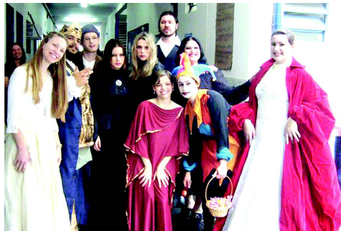
Durante o ano letivo o curso de Letras oferece inúmeras e variadas oportunidades de formação aos alunos além da sala de aula

O curso de Letras do UniAnchieta é reconhecido pela avaliação do MEC com nota 4 no ENADE, o que lhe conferiu em 2011, novamente, o reconhecimento por esse Ministério do Governo Federal (Portaria nº 295, de 28/07/2011 (R)) para a continuidade da oferta de vagas e funcionamento. Desde sua primeira turma, em 1973, o curso é oferecido no período noturno na modalidade Licenciatura, com aulas presenciais, contando hoje com 60 vagas anuais. Poderá ser integralizado em 6 (seis) semestres, equivalentes a 3050 horas/ aula/ e atividades acadêmico-científicas, das quais 400h são destinadas ao Estágio Supervisionado (Língua Portuguesa e Inglesa) e 200h às Atividades Complementares, além das 50h (mínimo) destinadas ao Trabalho de Curso desenvolvido sob orientação de um docente e defendido pelo aluno que se prepara para receber o certificado que lhe confere a graduação em Letras.