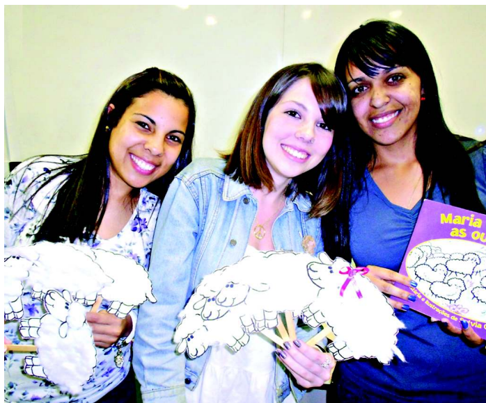
A educação infantil e o ensino fundamental são apenas algumas das áreas de atuação do licenciado em Pedagogia

O Curso de Pedagogia do Centro Universitário Padre Anchieta, um dos primeiros do Brasil, teve início no ano de 1968 e foi reconhecido em 1971. Nesses mais de 40 anos de existência demonstra à sociedade local e regional o alto grau de comprometimento com a formação de profissionais para a área da educação.