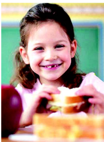
Os lanches devem ser práticos e ao mesmo tempo saudáveis