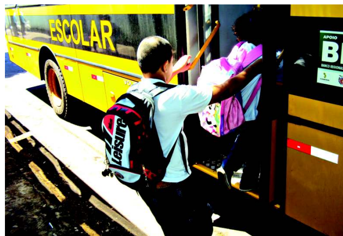
Muitas crianças utilizam o transporte escolar. Por isso todo cuidado é pouco na hora de contratar o profissional.