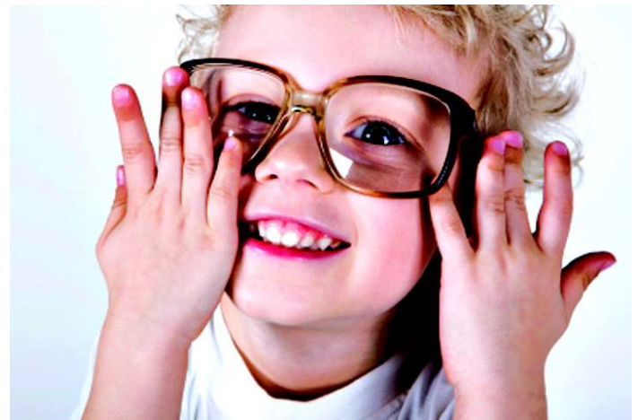
O uso do óculos é um importante auxílio para às crianças com problemas de visão

lizado nos dias atuais pela garotada e juventude são os óculos de sol. Neste caso a especialista recomenda apenas que o objeto tenha boa procedência. “Seria in-